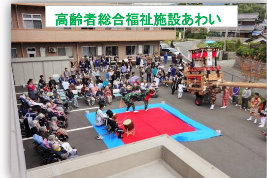
高齢者総合福祉施設あわい