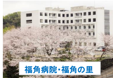
福角病院・福角の里